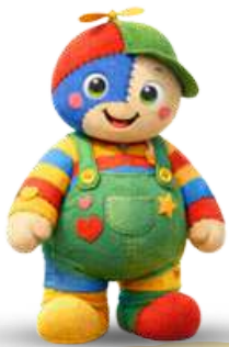
CENTRO ESTIVO INFANZIA