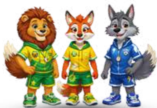
CENTRO ESTIVO PRIMARIA