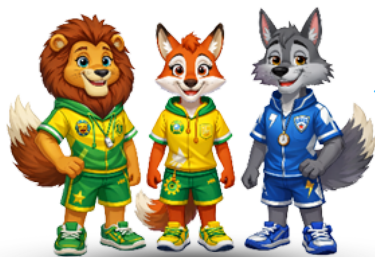
CAMPO SOLARE JUNIOR