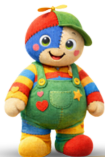
CAMPO SOLARE BABY