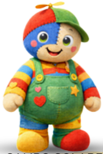
CAMPO SOLARE BABY