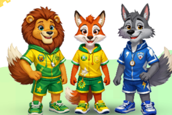
CAMPO SOLARE JUNIOR

CENTRO ESTIVO 2026 PER BAMBINI E BAMBINE DAI 3 AGLI 11 ANNI